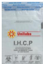
Sachet de transport