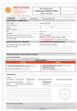
Fiche de demande